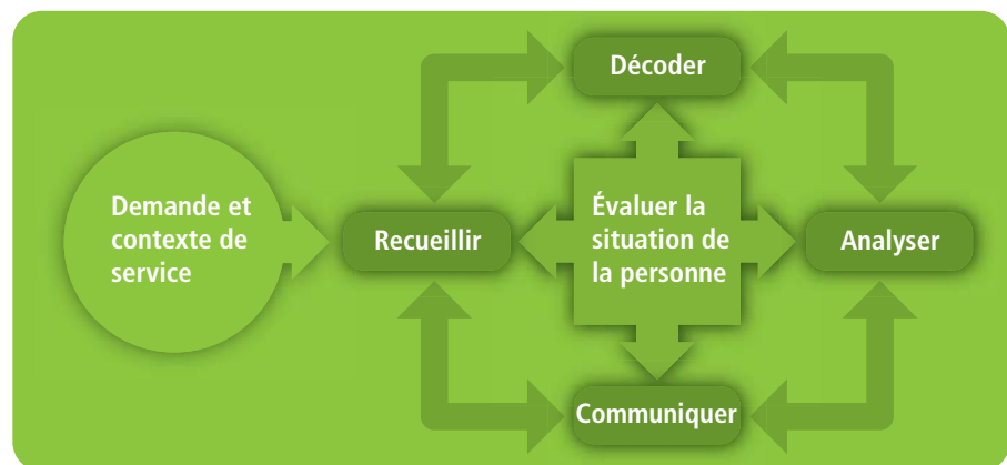
Figure 2 Modèle conceptuel d'évaluation en orientation

La figure 2 présente le modèle conceptuel d'évaluation en orientation composé de quatre phases non linéaires.