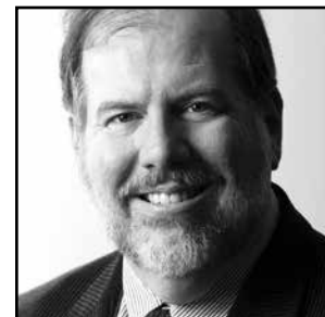
LAURENT MATTE, c.o., président de l'Ordre des conseillers et conseillères d'orientation du Québec

Nous avons également vécu l'organisation, avec nos partenaires, du Congrès international en orientation et en développement de carrière (juin 2014 à Québec) qui a attiré des présentations d'un haut niveau, de tous les continents.